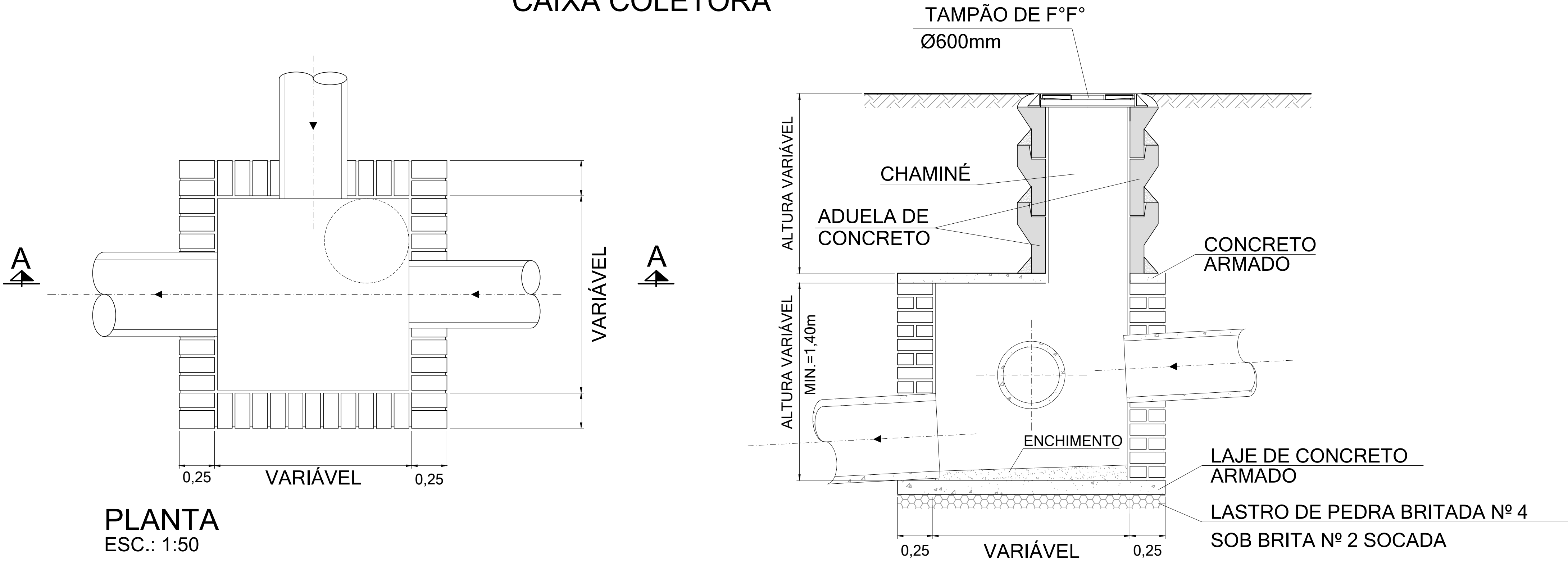
PLANTA ESC.: 1:50